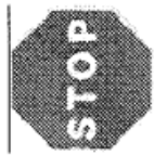
R-2 Detenció obligatòria