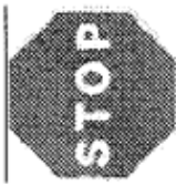
R-2 Detenció obligatòria