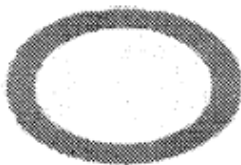
R-100 Circulació prohibida

OM 152 - 2A L No obeir un senyal de circulació prohibida (senyal vertical R-100). 90 €