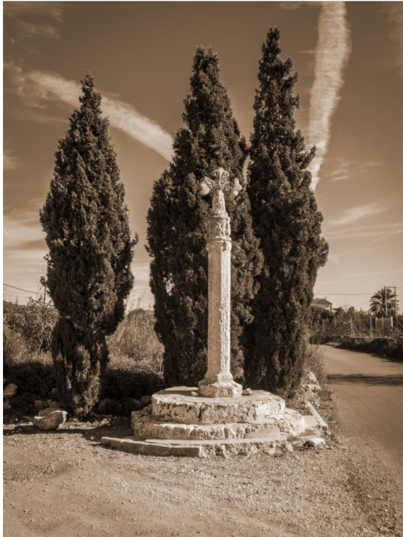
Creu de terme.