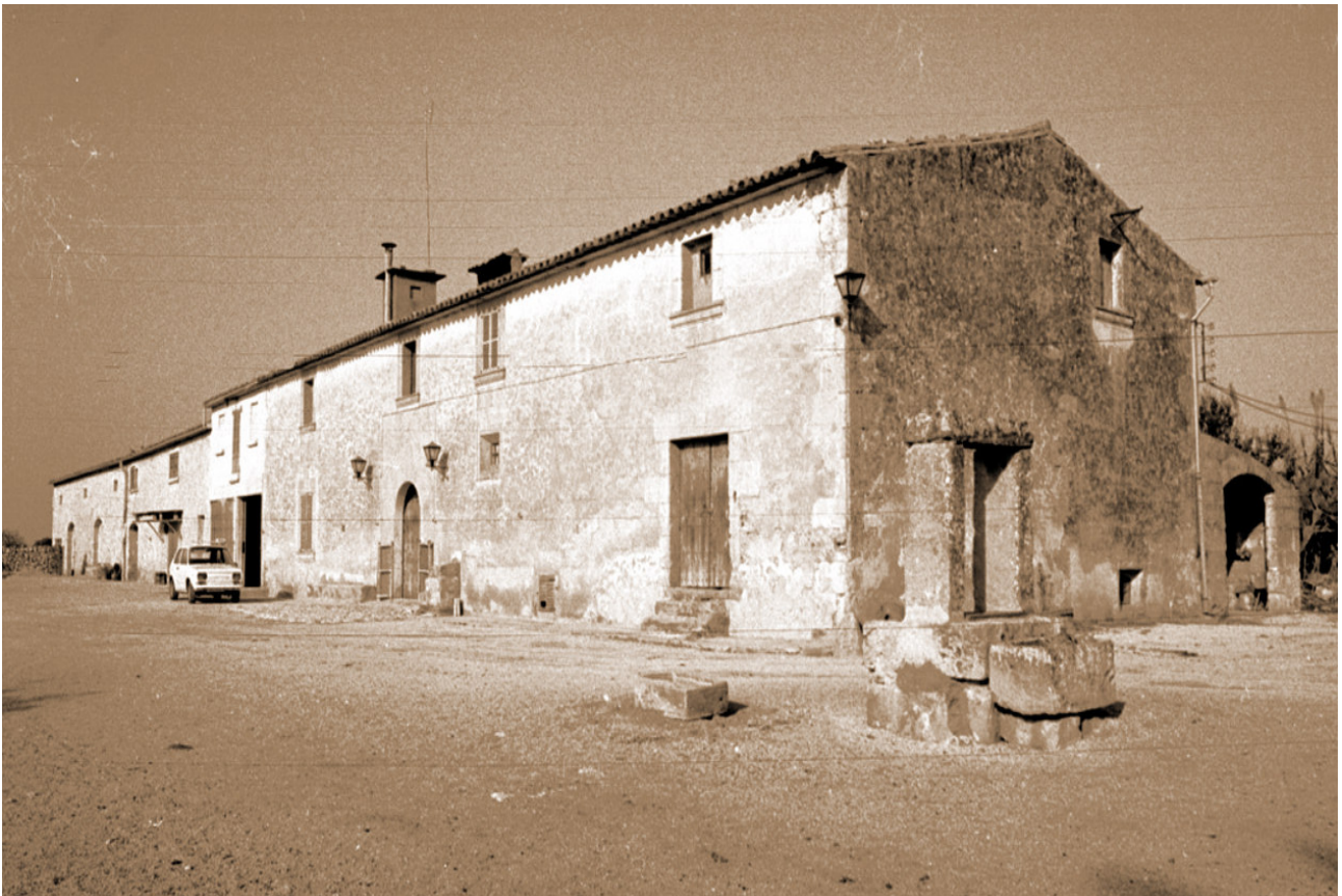
Possessió es Masdeu.