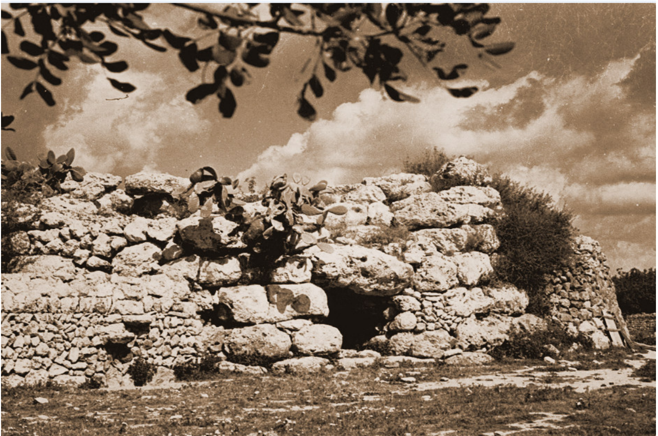
Talaiot de Son Noguera.