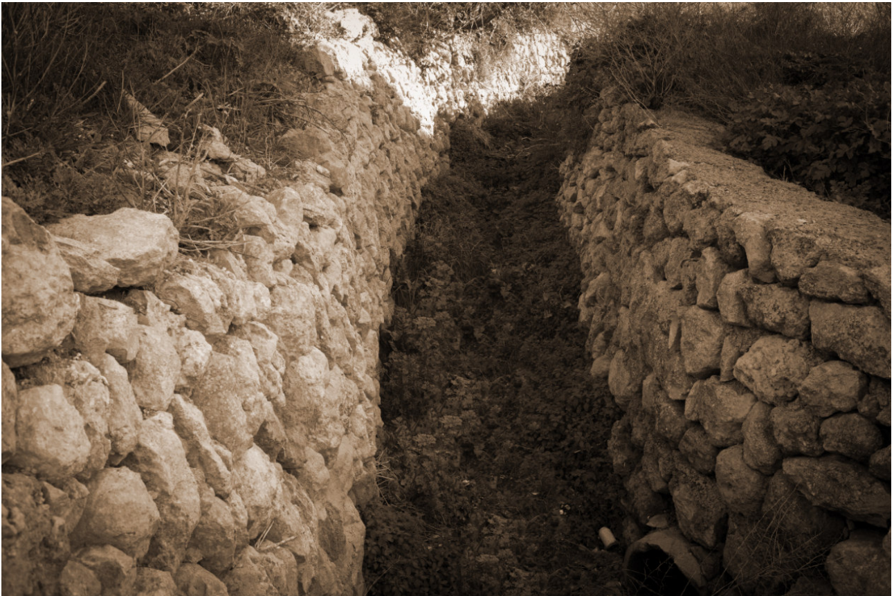
Torrent de na Joanota.