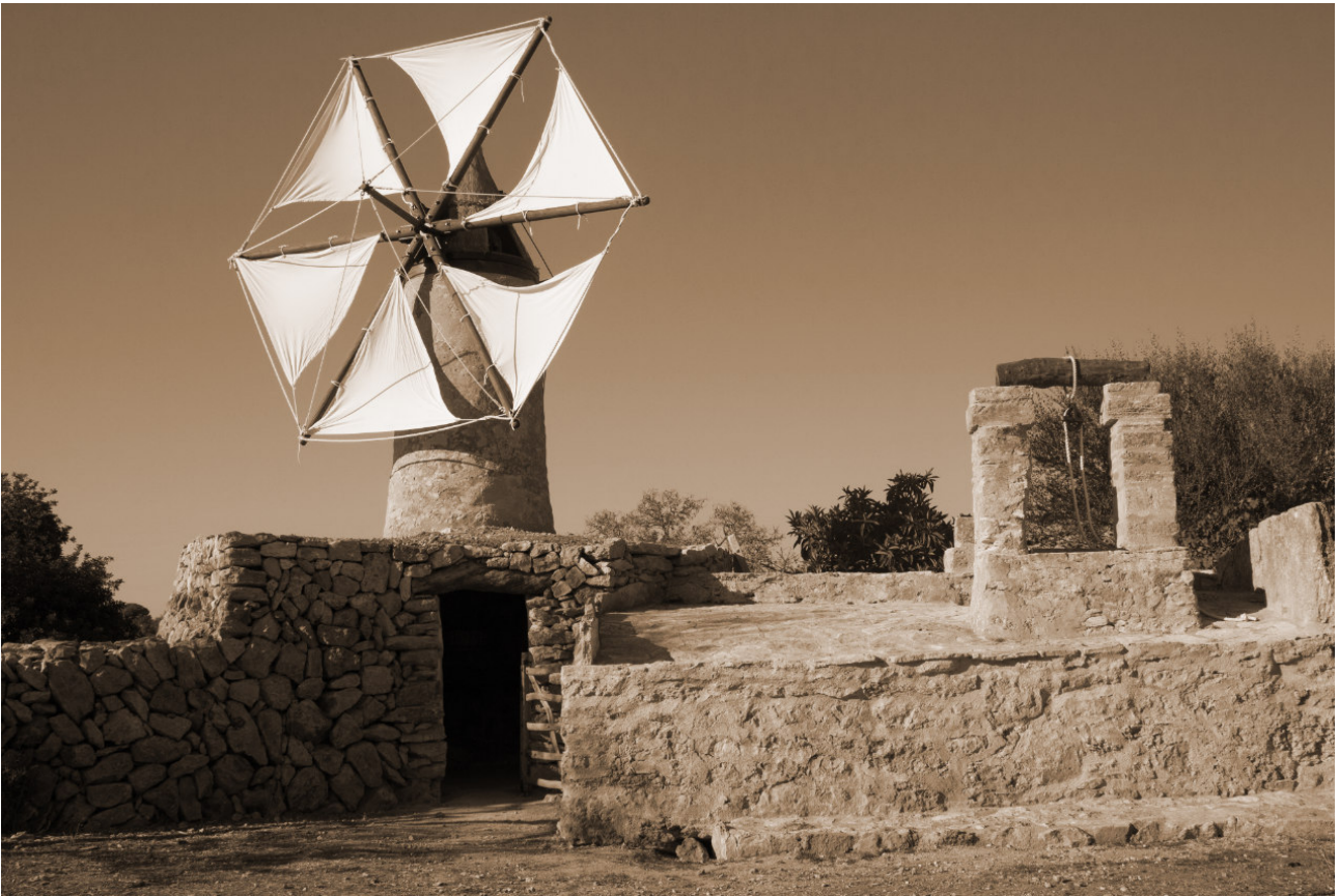
Molí de Can Garra-seca.