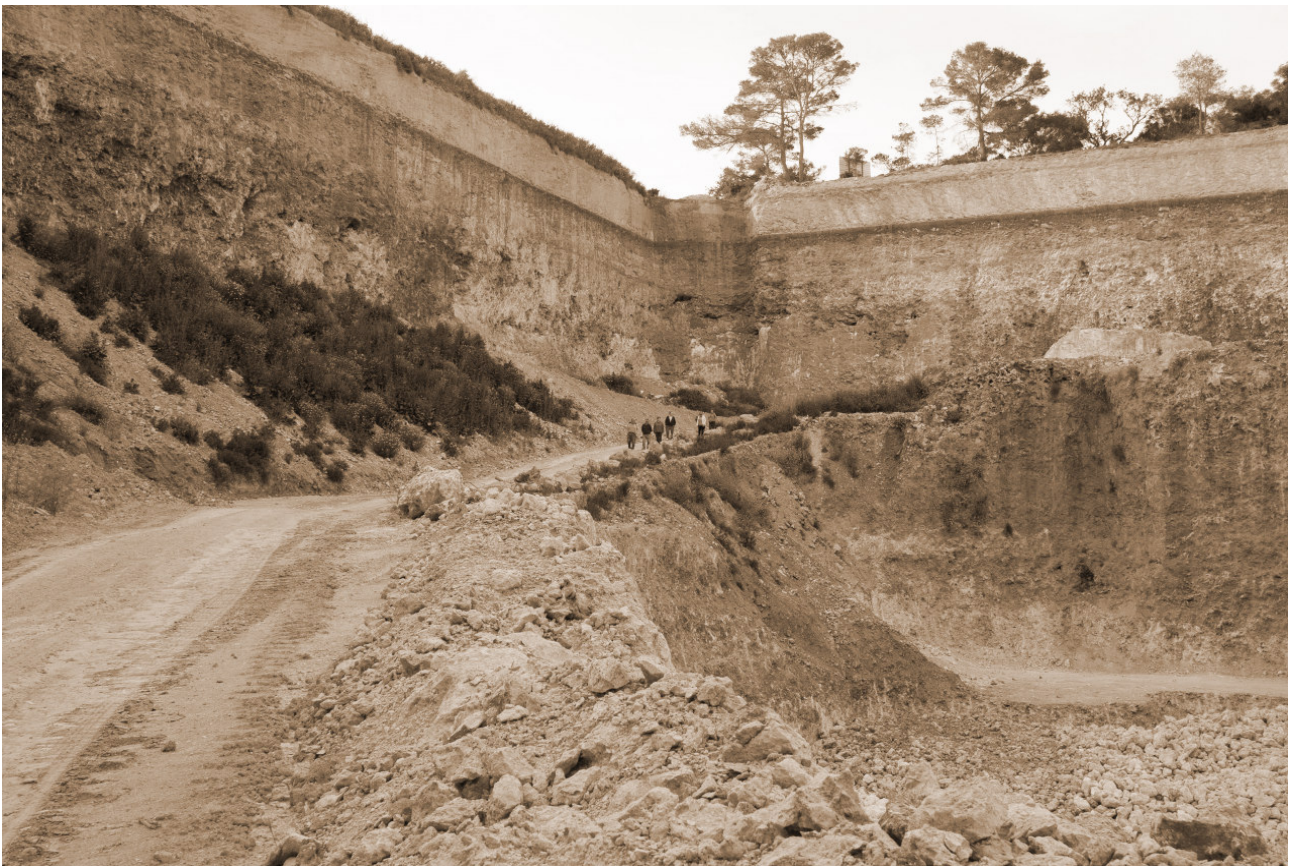
Pedrera de Son Delabau. Fotografia d'Antoni Montserrat