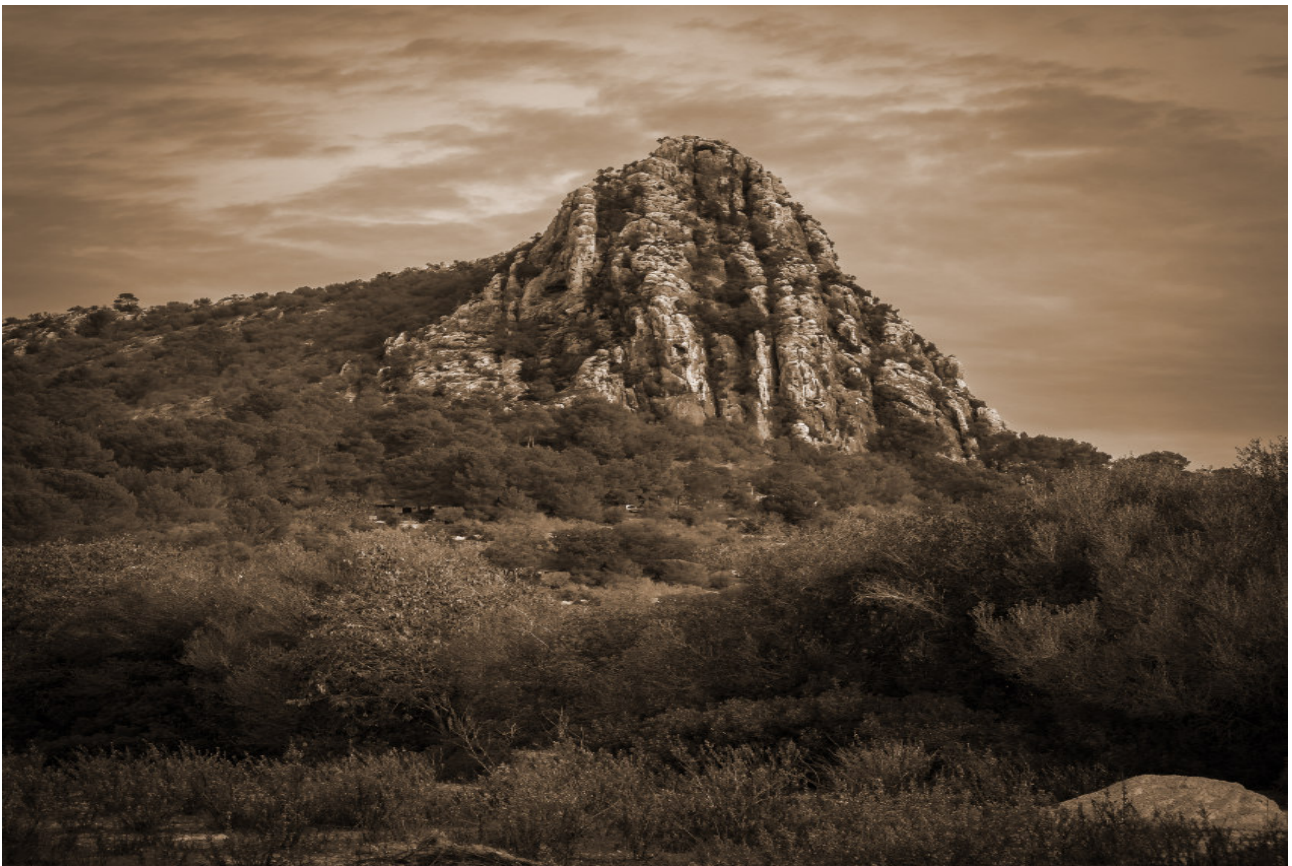
Puig de ses Bruixes (també Puig de Son Saleta).