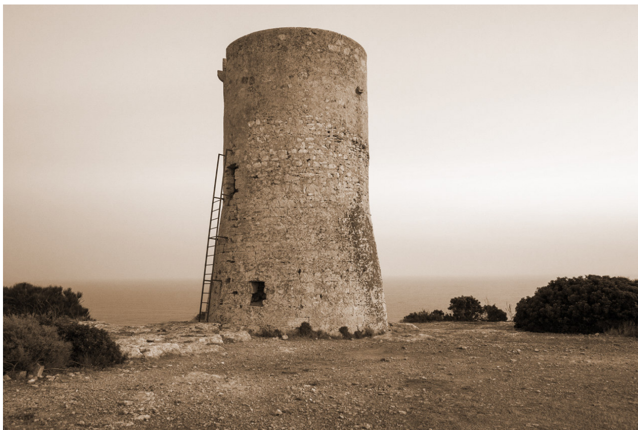
Torre des Cap Blanc (també Torre Vella).