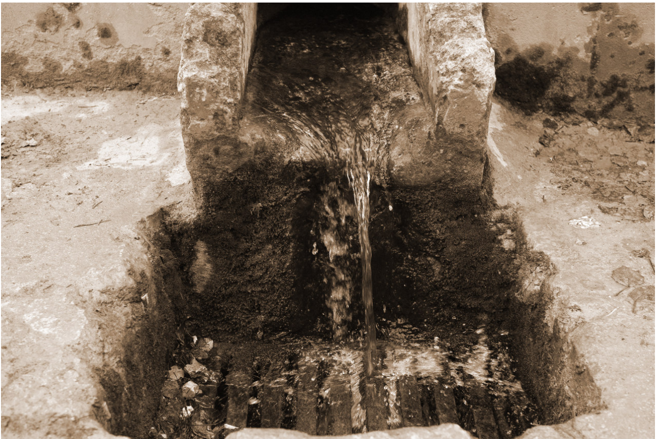
Font de ses Piquetes des Pèlec. Fotografia d'Antoni Montserrat