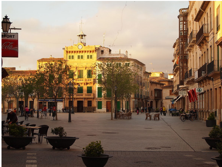
Plaça d'Espanya. Lluçmajor

El terme municipal de Lluçmajor està format per: