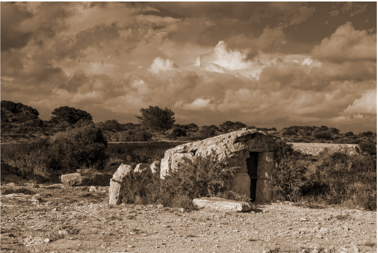
Barraca des Cap Blanc. Fotografia d'Antoni Montserrat