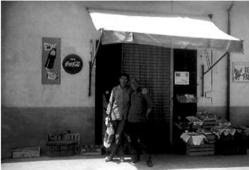
Botiga de queviures de Can Restes l'any 1960.