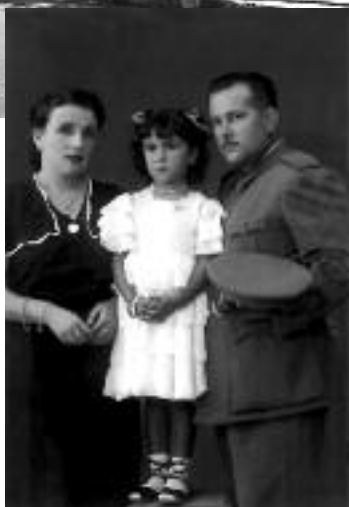
El vestit de volants, regal de madò Catalina, amb el qual l'autora va guanyar un premi al Líric l'any 1948. (Arxiu particular).