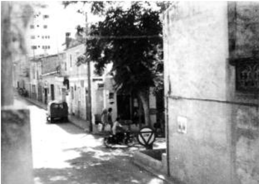
Ca sa Poblara. Després va ser La Marina.