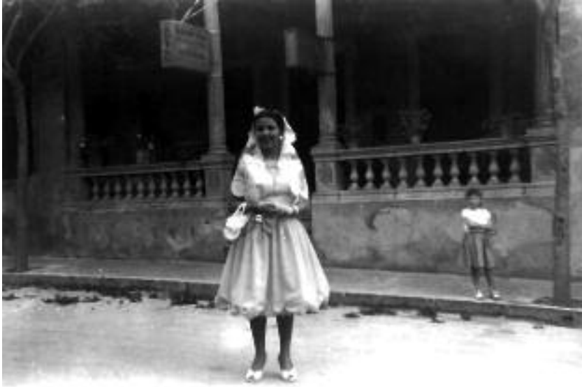
Al fons, la casa d'ampla façana on hi havia la barberia i perruqueria. L'autora del pregó enllestida per anar a la processó del Corpus.