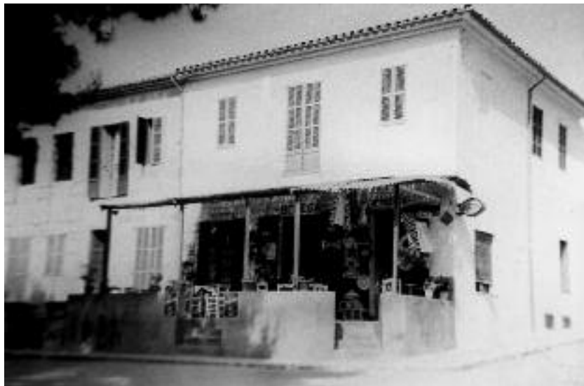
Entrada de la Bodega Clar. (Cortesia de Nofre Llinàs).

sident de tres clubs de petanca. El negoci tancà fa uns anys i ell morí de llarga malaltia.