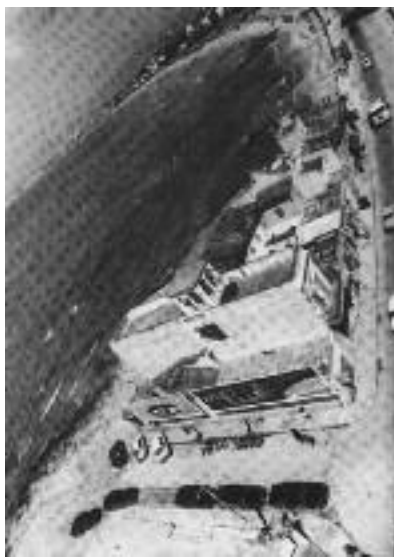
La illa dels Republicans abans i ara.