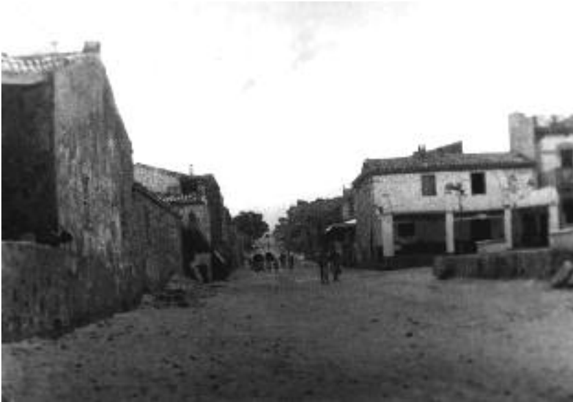
A la dreta, Ca s'Espirut, avui la cafeteria San Diego.