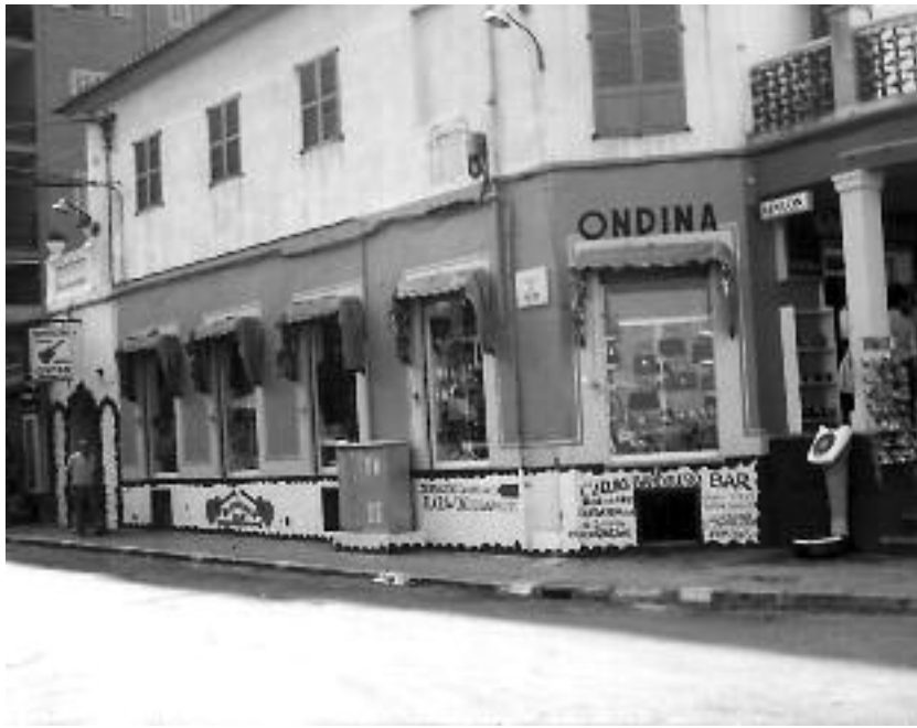
Mostradors dels Souvenirs Ondina.