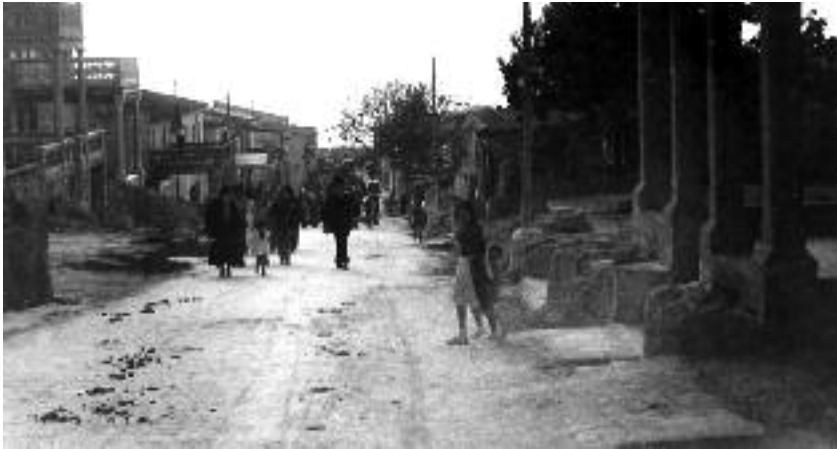
El carrer de Sant Cristòfol els anys 40. (Cortesia de Tomeu Sbert).