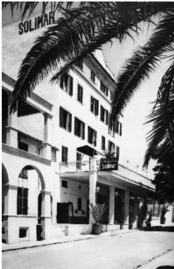
L'Hotel Solimar l'any 1959.