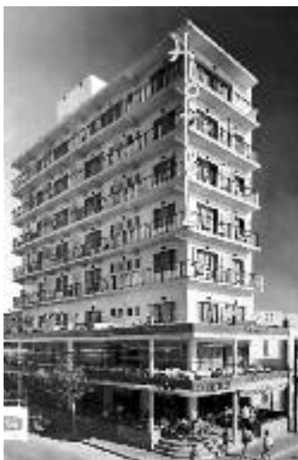
L'Hotel San Diego l'any 1963.