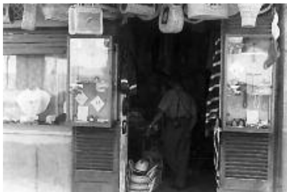
Entrada dels Souvenirs Can Rei.