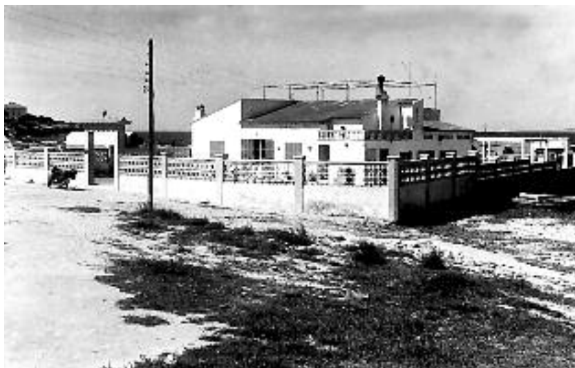
L'antic club nàutic.