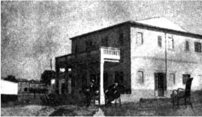
L'Hotel Terminus, el primer hotel que es va construir, l'any 1915.