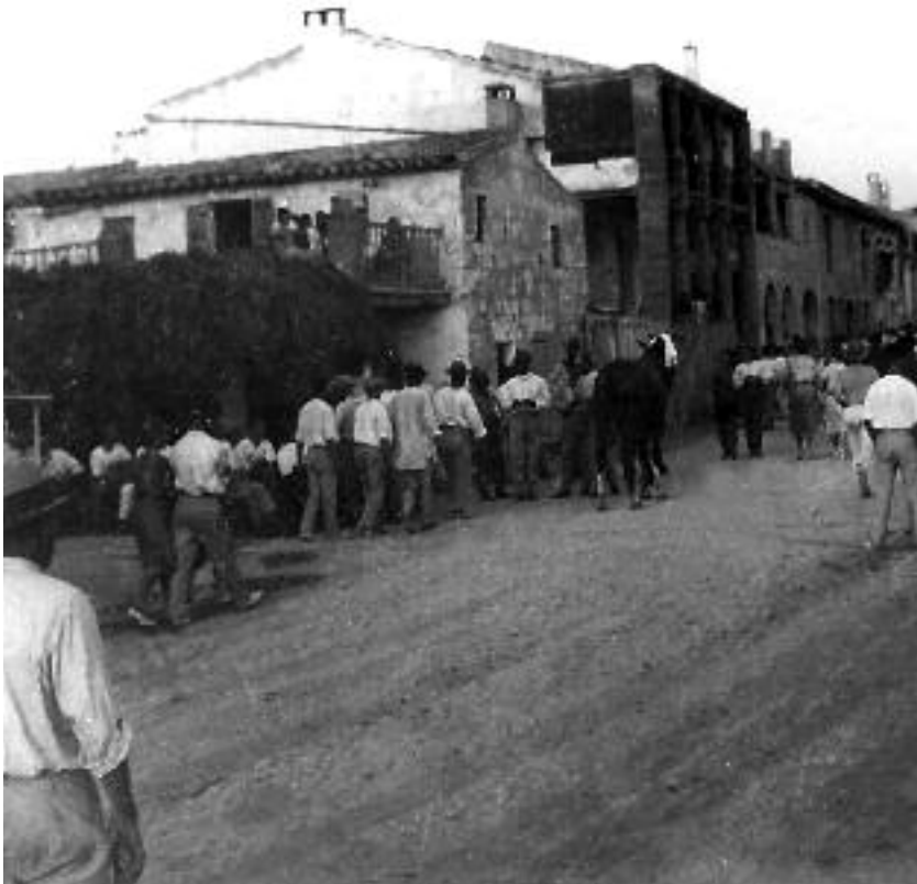
La primera tenda a s'Arenal avui és l'Hotel Mediodía (carrer de Sant Cristòfol).