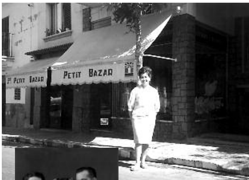
Tejidos Sastre ja remodelat i convertit en el Petit Bazar.