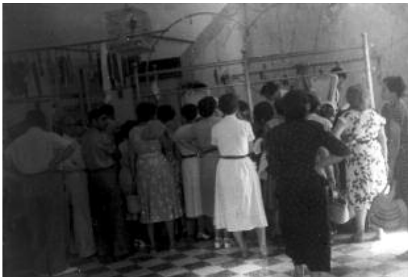
La carnisseria Can Monjo, com sempre plena de gent.