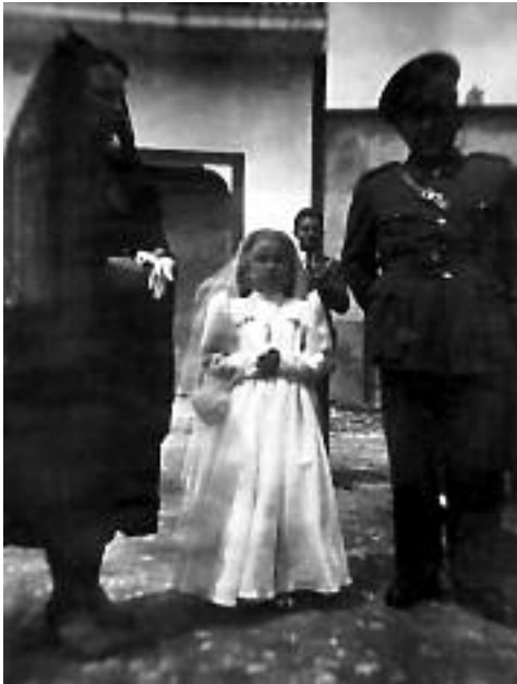
L'autora el dia de la seva comunió el 1949. Al fons, les façanes de la illeta dels Republicans.