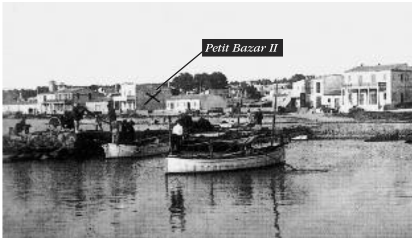
La creu indica el solar on es va construir el Petit Bazar II.

L'any 1960 compràrem l'altre local de veïnat i deixàrem la tenda que teníem llogada. Després de les reformes hi posàrem articles de marroquineria i peces de pell, que era el que a mi més m'agradava. Devers l'any 1962 mon pare comprà un solar al carrer de Miramar núm. 11, a on també hi posàrem botiga de pell. Hi vaig estar treballant fins a l'any 1991, que la traspassàrem. Ara hi venen roba d'esport. A l'any 1970 també traspassàrem les del carrer de Sant Cristòfol: a una hi ha els Hermanos Izquierdo i a l'altra es ven artesanía africana. Aquesta fou l'evolució dels nostres negocis a s'Arenal.