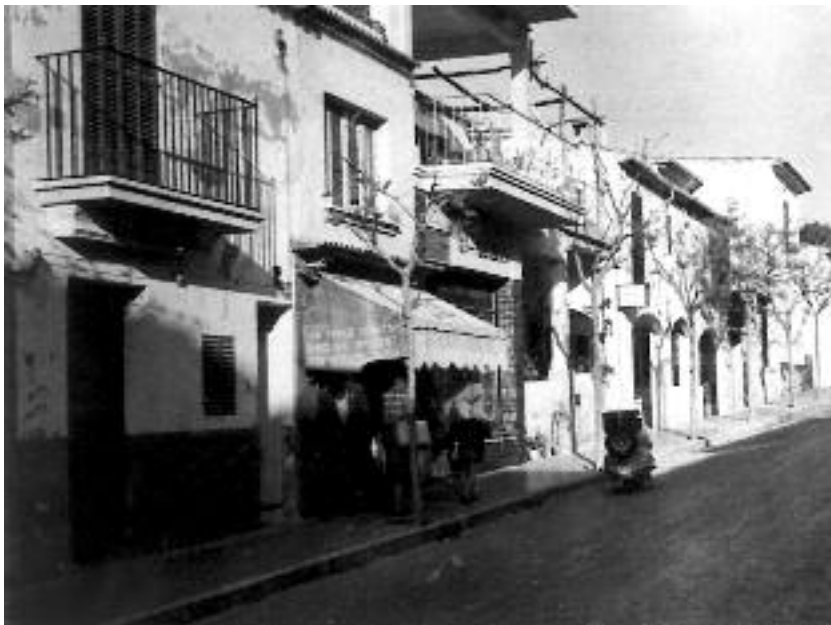
Tejidos Sastre, després el Petit Bazar.