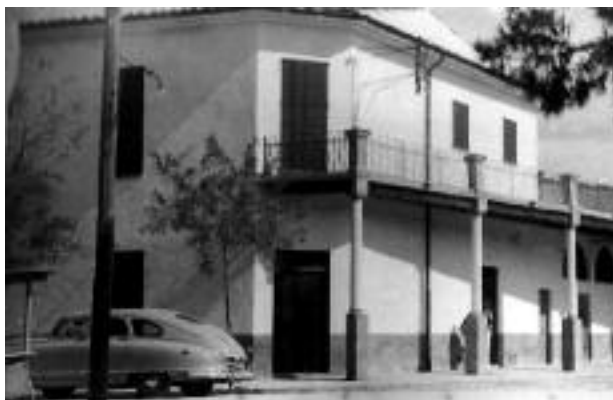
Façana de la carnisseria Can Monjo.