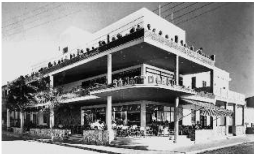
La cafeteria San Diego l'any 1960.

En Tomeu i la seva germana, na Bel de Ca na Grina , es tornaren a fer càrrec de la fonda. Na Bel, el 1961 es casà amb mestre Bernat Gelabert Misser , mestre d'obres, i als pocs mesos de tornar a tenir Ca na Grina l'esbucaren per fer-hi un hotel de quatre plantes, de nom Cel Blau . Un any després afegiren l'alçada que faltava fins als trenta metres. El meu sogre morí l'any 1975 sense poder veure com, un any més tard, en Pere comprava el Cel Blau , l'ajuntava amb la resta i el convertia en l'actual Hotel San Diego , de 350 llits.