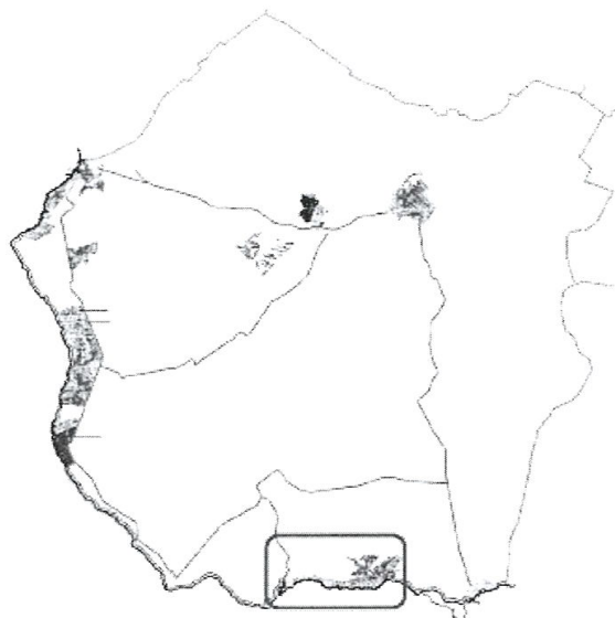
Terme municipal de Lluçmajor. Ubicació de les urbanitzacions de Cala Pi, Vallgornera Nou i Es Pas de Vallgornera.